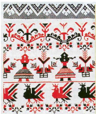
Полотенце. Село Опальково Кромского уезда Орловской губернии. 1910-е годы.

Облакоподобие образов — наиболее специфичная черта «орловского списка». Мировоззренческие идеи единения человека и окружающей природы настолько глобальны и глубоки, что они владели творческим воображением людей, в особенности крестьян, до самого позднего времени, и благодаря этому до нас дошли художественные и эстетические ценности, заложенные в памятниках «орловского списка».