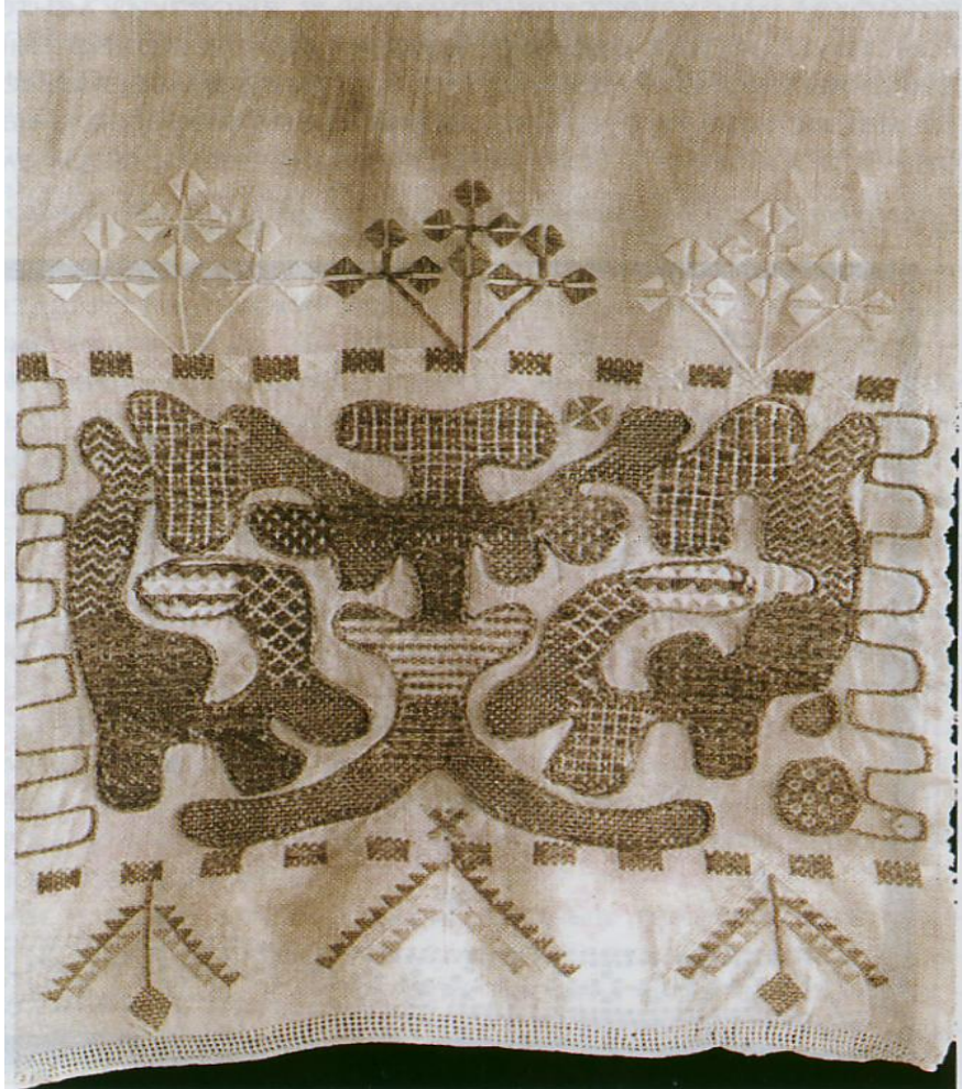
Полотенце. "Орловский спис". Конец XIX века.

Этим своеобразным шитьём владели «барские» (бывшие помещичьи) крестьянки Орловского, Кромского, Дмитровского, Малоархангельского, Карачевского уездов. Интересно, что ареал бытования списового шитья очень близко совпадает с картой вятических поселений на территории Орловского края.