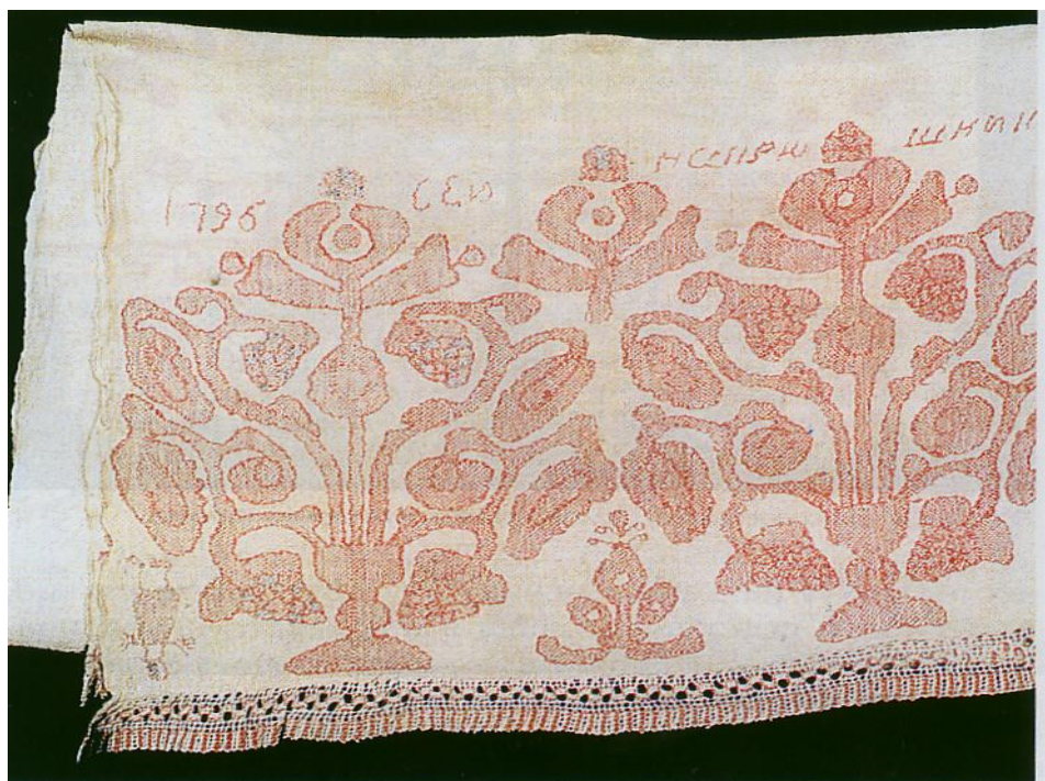
Полотенце. Работа крепостной Драчевой. Мценский уезд Орловской губернии. Конец XVIII века.

Для старого «списового шитья», которое можно встретить в орловских сёлах на полотенцах, и сегодня типичны одночастные композиции. Изображения «древа» или «птицы-павы» либо заполняют поле вышивки до самых краёв, либо окружены рамкой строгого рисунка, подчеркивающего массивность и насыщенность цветом сказочных фигур.