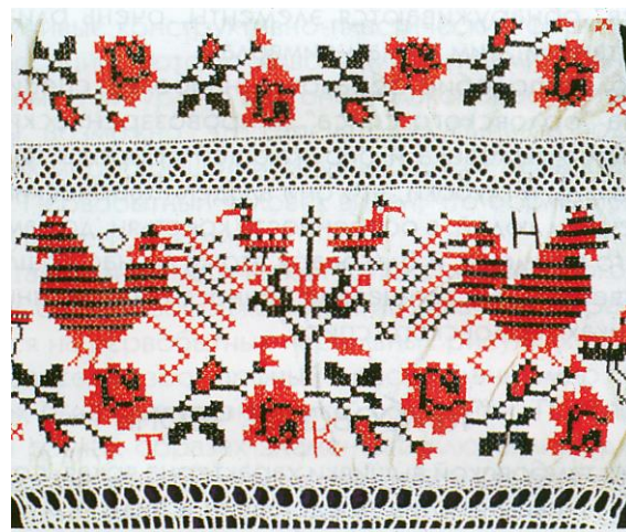
Полотенце. Село Лаврово Орловского уезда. 1910-е годы.

«Орловский спис» [Текст] // Славянский мир / сост. Р. В. Андреева, В. В. Будаков, Л. Ф. Попова. – Воронеж, 2001. – С. 91 - 93.