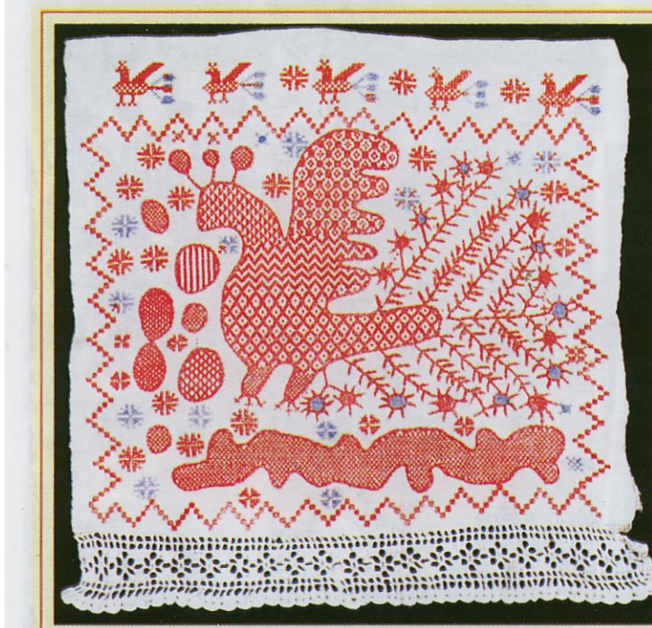
Полотенца из села Золотарево Орловского уезда. Конец XIX - начало XX век

животворные свойства. Очень близко повторяются в списовых элементах амулеты древней Руси в виде петушков, коников, уток.